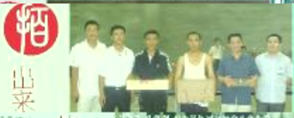
滨农首届乒乓球赛颁奖仪式

本报讯 9月25日上午9时30分，滨农首届乒乓球赛在滨农公司篮球场拉开帷幕。本次比赛由滨农公司工会主办，旨在丰富员工的业余生活，增强团队凝聚力。比赛吸引了众多员工踊跃参加，现场气氛热烈。经过一天的激烈角逐，滨农队最终夺得冠军。滨农公司领导对参赛选手表示祝贺，并感谢大家对滨农事业的辛勤付出。